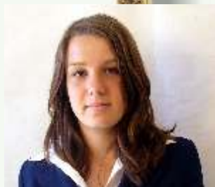
ZAIIE C T LINA