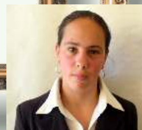
VRAN U VALENTINA